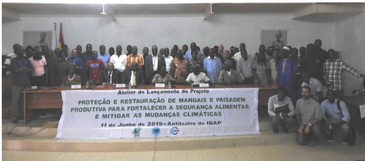
Atelier de lancement du projet

Suite à la présentation des objectifs du projet et de son mode opérationnel, le Plan de travail pour l'année 1 du projet a été présenté et discuté. Enfin une présentation du Programme global TRI a permis d'expliquer le contexte du projet national au sein de ce grand Programme regroupant dix pays d'Afrique et d'Asie sous la responsabilité de 3 Agences d'exécution à savoir l'UICN, le PNUE et la FAO sur financement du GEF. Un rapport d'Atelier, résumant les principales interventions et recommandations, a été rédigé pour la circonstance ( Rapport disponible ).