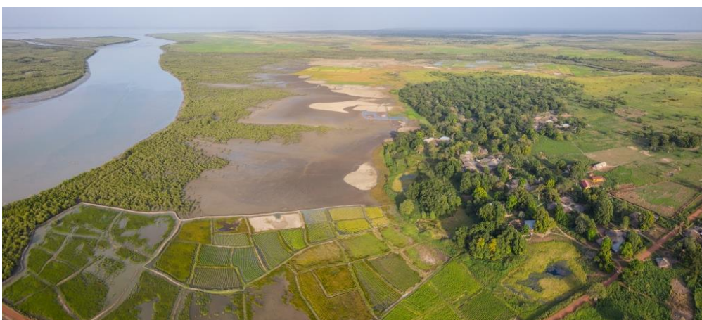
Rizières et mangroves de la région centre (Quinara)

Les premiers mois du projet ont essentiellement permis de formaliser les partenariats et les procédures de gestion, de recruter le personnel et de faire l'acquisition des premiers équipements. En dépit des obstacles évoqués plus haut, la dynamique du projet est désormais une réalité. Elle va ainsi pouvoir se concrétiser sur le terrain dès la fin de la saison des pluies.